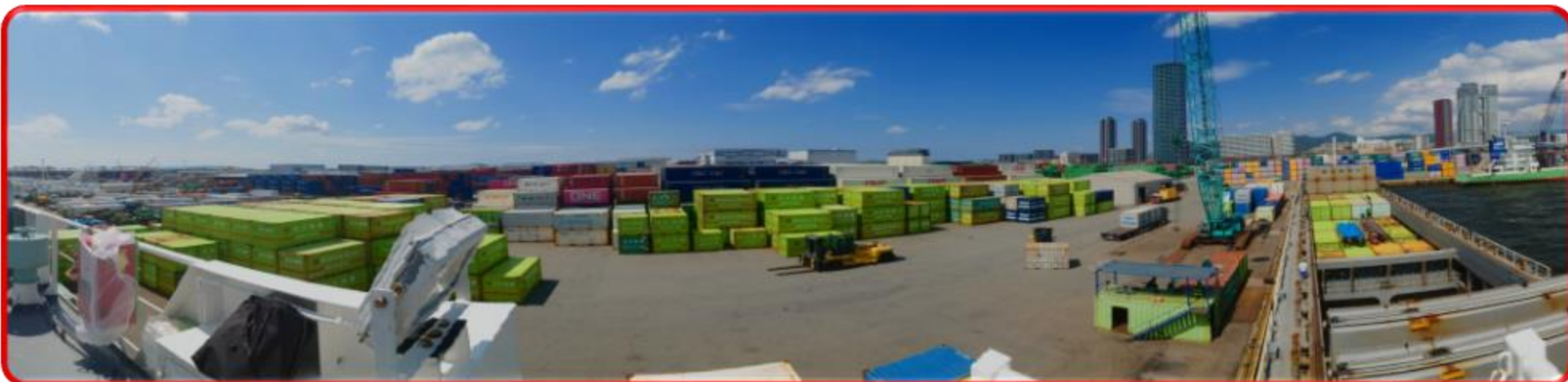
ヤード及び荷役風景