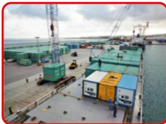
ヤード及び荷役風景①