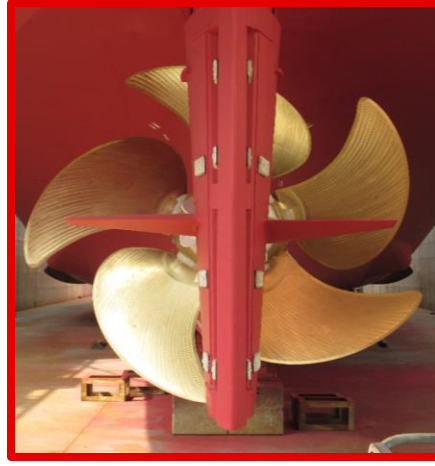
5翼可変ピッチプロペラ