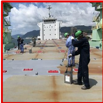
ハッチカバー塗装作業