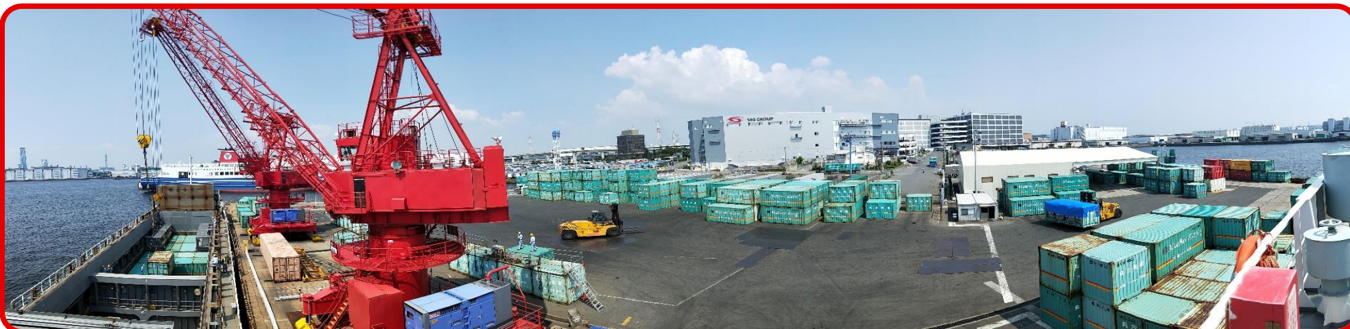
ヤード及び荷役風景