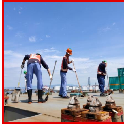
荷役後ハッチカバー清掃