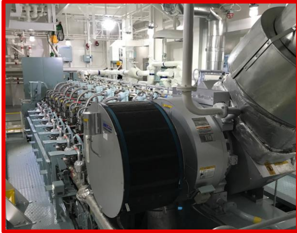
主機 (阪神 8S35MC7/8080PS)