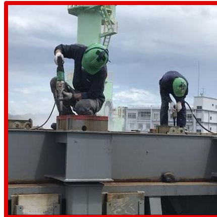
ハッチカバー錆打ち