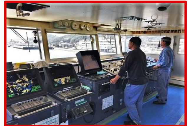
ドック出渠後海上試運転